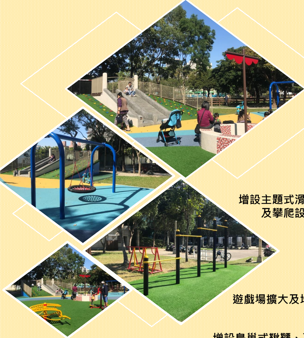
增設主題式滑梯 及攀爬設施