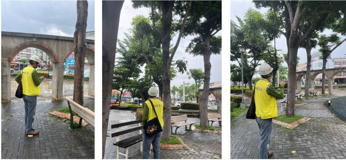
臺中市建設局養護工程處(新建工程處) 現場勘查樹木健診暨風險初估紀錄表