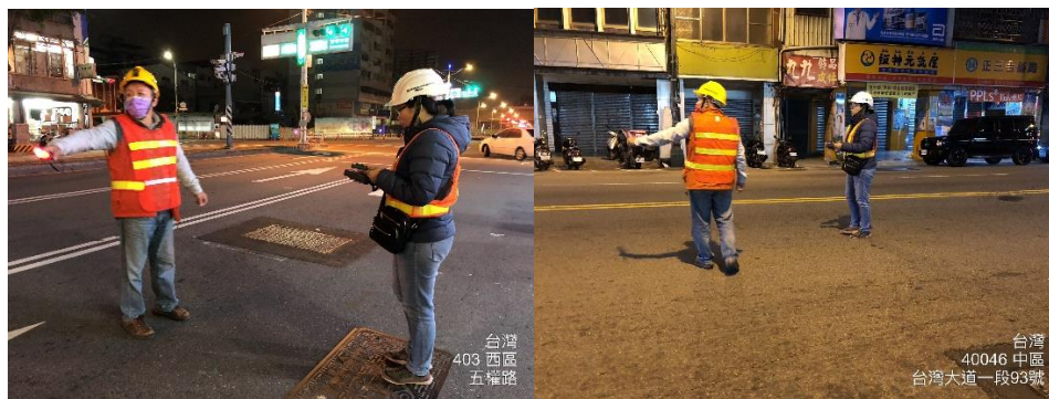
圖 3、道路照明普查作業現場畫面

三、大專院校周邊道路照明提升:市府注重市民夜間用路安全，亦同時關心本市大專院校周邊學子通學道路照明環境，盼提供用路民眾及師生有個安全道路。市府於去(109)年 11 月起陸續走訪本市 18 所大專院校，邀集場勘周邊通學環境，共同研商強化照明維護用路人安全，保障學生有安全回家道路 [參閱圖 4 及圖 5]。