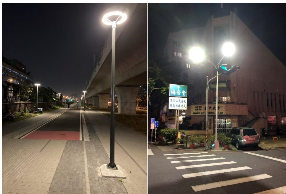
圖 7、(左)中山醫旁景觀燈、(右)台中科技大學_五常街中華路口