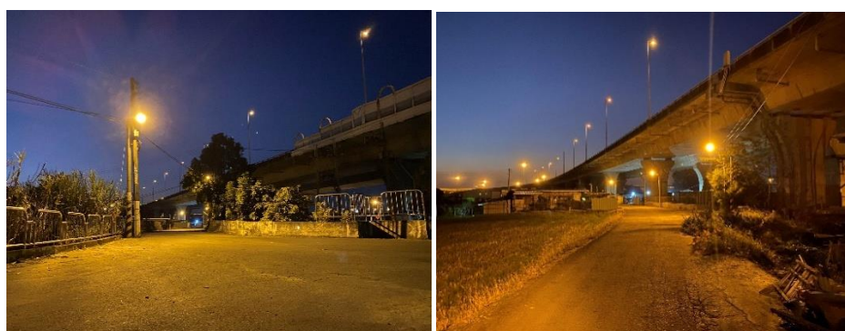
圖 6、偏鄉點燈成果照

二、 道路照明提升：臺中市主要幹道照明普查結果主要道路第一階段普查完成，於 3 月派工完成，於 5 月底前完成設置，總計新設路燈 7 盞、汰換老舊燈具 109 盞。建設局於今年