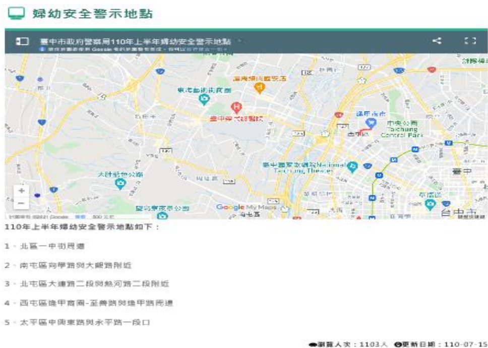
圖 2、警政公開資訊 110 年上半年婦幼安全警示地點

路與逢甲路周邊、太平區中興東路與永平路一段口，為提升用路安全，建設局提出主次要道路照明普查及校園周邊照明提升作業。