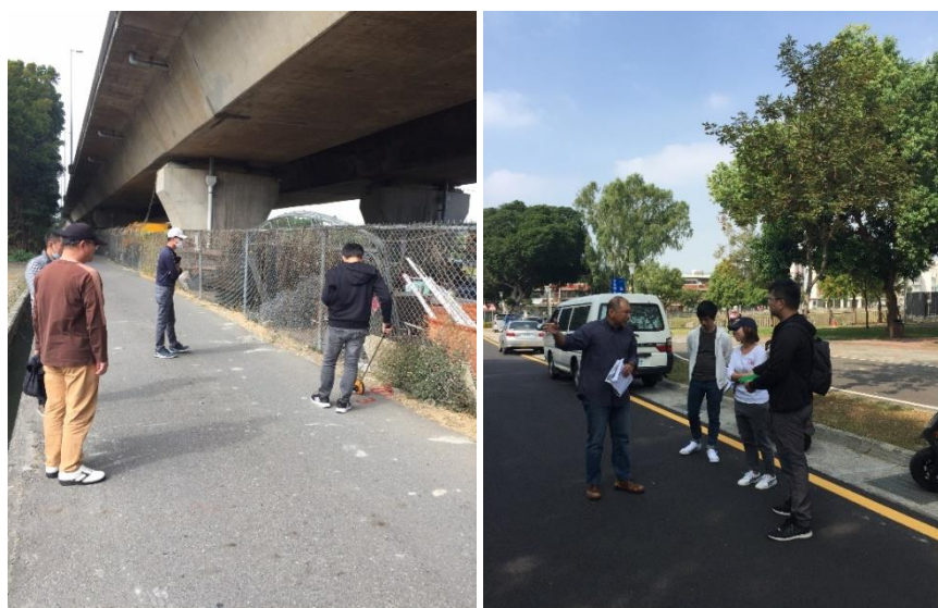
圖 4、(左圖)最左邊是亞洲大學教官(右圖)最左邊是勤益科大的教官

三、大專院校周邊道路照明提升:市府注重市民夜間用路安全，亦同時關心本市大專院校周邊學子通學道路照明環境，盼提供用路民眾及師生有個安全道路。市府於去(109)年 11 月起陸續走訪本市 18 所大專院校，邀集場勘周邊通學環境，共同研商強化照明維護用路人安全，保障學生有安全回家道路 [參閱圖 4 及圖 5]。